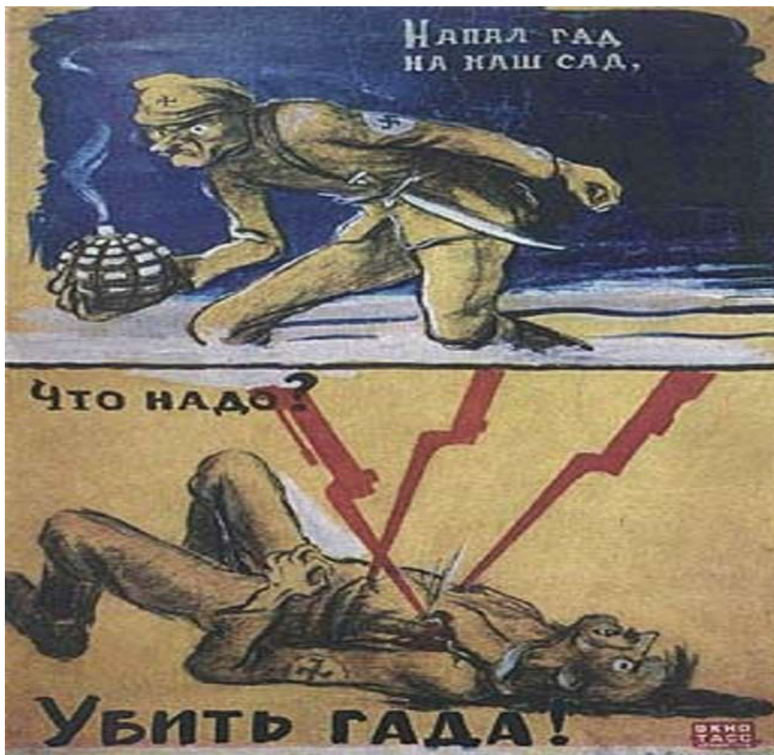
Рис. 3. Плакат «Напал гад на наш сад. Что надо? Убить гада!»

Вопросительное предложение текста делает зрителя активным творцом и вызывает единственно возможный ответ, втягивает в диалог с авторами плаката, что убеждает и вдохновляет зрителя.