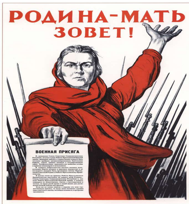
272. Тоидзе И. Родина-мать зовёт! 1941