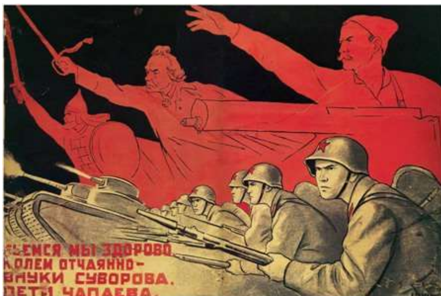
Рис. 5. Плакат «Бьёмся мы здорово, колем отчаянно. Внуки Суворова, дети Чапаева»

Плакат «Бьёмся мы здорово, колем отчаянно. Внуки Суворова, дети Чапаева» создали в 1941 г. художники Кукрыниксы, текст написал С.Я. Маршак (см. рис. 5). Выразительность этого плаката обусловлена сочетанием исторических изображений, которые наглядно демонстрируют связь поколений, их преемственность.