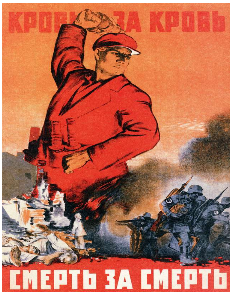
Рис. 2. Плакат «Кровь за кровь, смерть за смерть!»

Красный цвет плаката символизирует пролитую кровь и тех, кто погиб на поле боя, и невинно погибших детей, цвет воздействует эмоционально на зрителя, вызывает ненависть к врагам и желание отомстить. Очень важна главная фигура на плакате, так как это динамическое изображение, основанное на иллюзии движения. Воображение зрителя достраивает и предшествующие, и последующие движения. Замах кулака – и – последующий удар! «Динамическое изображение – это всегда маленькое повествование о каком-то событии или действии, имеющем начало, течение и предполагаемый конец» (Кудин, Ломов, Митькин, 1987, с. 53).