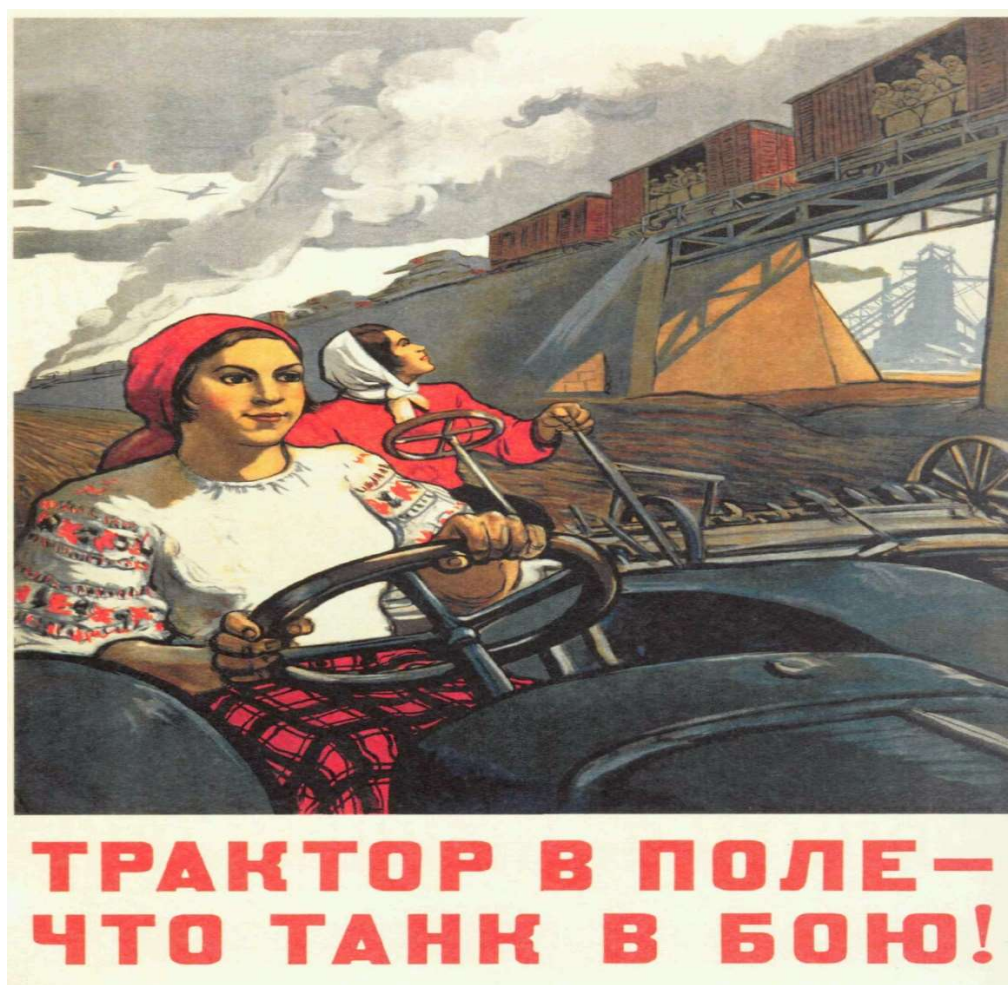
Рис. 6. Плакат «Трактор в поле – что танк в бою»

Институт психологии Российской академии наук. Человек и мир. 2018. Том 2, № 3(5) доброты, любви. Плакат «Трактор в поле – что танк в бою» создан в 1943 г., художники В. Иванов, О. Бурова (см. рис. 6). Женский образ этого плаката содержит в себе несколько составляющих, молодая девушка управляет трактором, она заменила ушедшего на фронт тракториста, она настоящая советская работница, но яркая нарядная блузка показывает нам молодую красивую женщину, она олицетворяет мирное время. Яркий текст содержит в себе тире и восклицательный знак, что еще больше активизирует его воздействие. Динамика плаката ощущается в движении поезда, направляющегося на Запад, на фронт, который везет новые танки, также в движении и трактор, и сеялка, и девушки, сеющие хлеб. Значит будет урожай, значит несмотря на тяготы войны, жизнь продолжается, и в тылу поддерживают фронт, работают под девизом: «Все для победы».